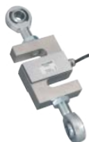
Rotules - Rod end ball joints