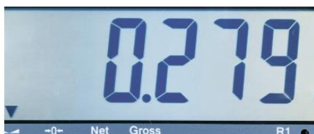
Écran LCD rétroéclairé