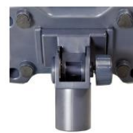
Support pour colonne