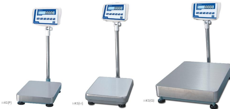
Báscula monocélula ▪ Bascule monocapteur ▪ Bench scale