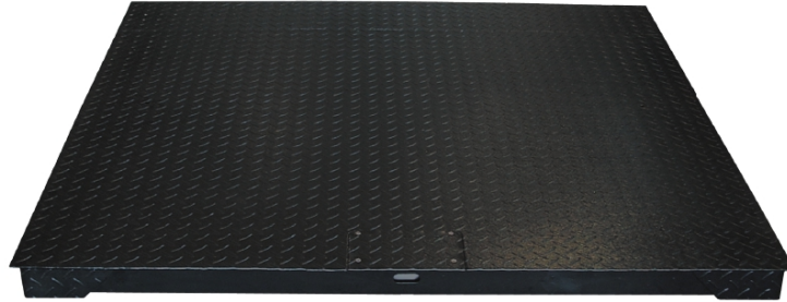
Plataforma de 4 células • Plate-forme avec 4 capteurs • 4 load cells platform